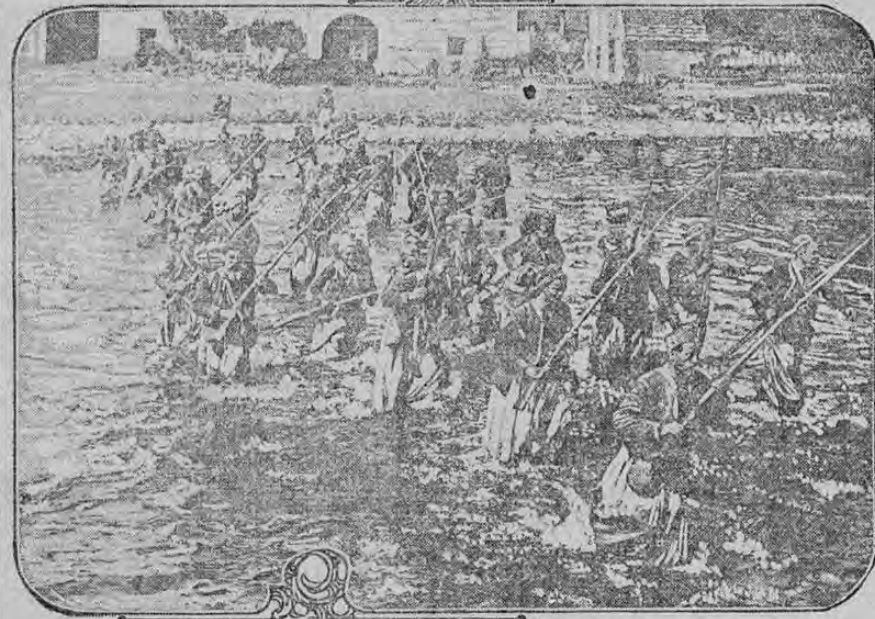
TURCOS FORDING RIVER FOR BATTLE

Los argelianos avanzando a través de un riachuelo al llevar a cabo un violento ataque contra los alemanes